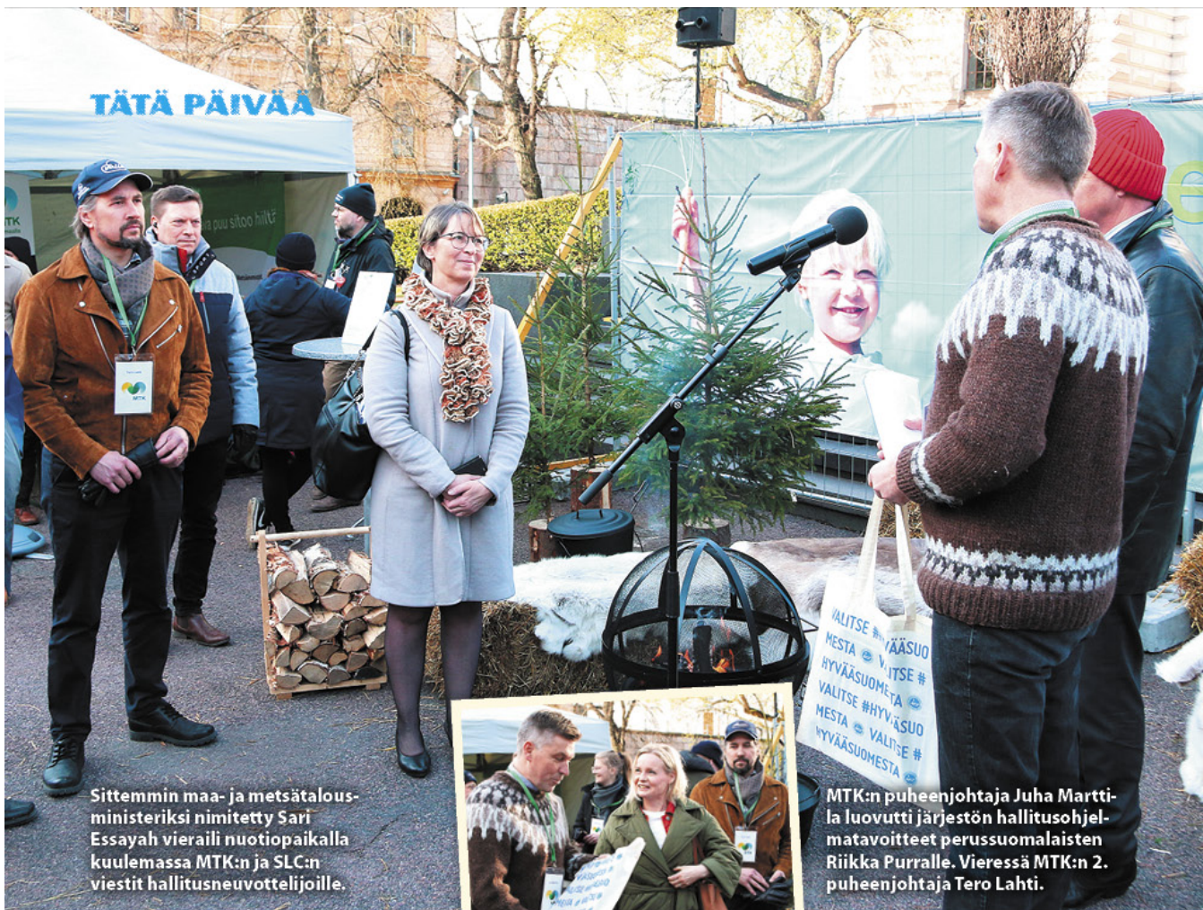
Sittemmin maa- ja metsätalousministeriksi nimitetty Sari Essayah vieraili nuotiopaikalla kuulemassa MTK:n ja SLC:n viestit hallitusneuvottelijoille.