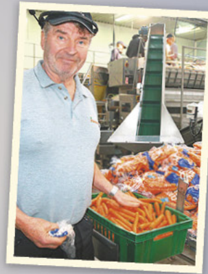
Hyytiäisen tilalla on viljelty porkkanaa jo 1950-luvun lopulta lähtien. Sadon lajittelu ja pakkaaminen vaatii paljon työvoimaa.