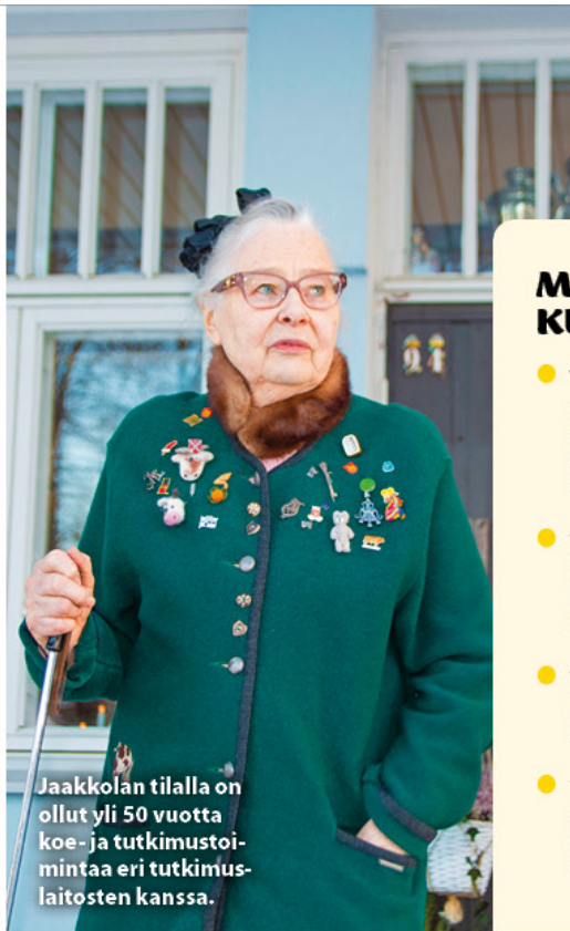
Jaakkolan tilalla on ollut yli 50 vuotta koe- ja tutkimustointintaa eri tutkimuslaitosten kanssa.