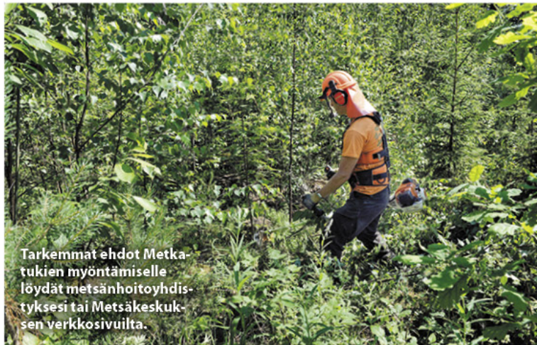
Tarkemmat ehdot Metka-tukien myöntämiseksi löydät metsänhoitoyhdistyksesi tai Metsäkeskuksen verkkosivuilta.

Taimikonhoito ja nuoren metsän hoito ovat jatkossa yksi työlaji, minkä tarkoituksena on ohjata oikea-aikaiseen metsänhoitoon. Tukea voidaan myöntää seuraaviin metsänhoitotöihin: taimikon varhaisperkaus, taimikon harvennus, nuoren metsän harvennus, verhopuuston poisto ja verhopuuston harvennus. Tukea voi saada myös hoitotöiden yhteydessä kaadetun pienpuun keräämiseen. Perustuki on 200 euroa hehtaarilta ja